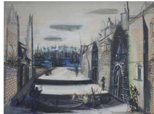
ジャン・カルズー 水彩画 12号 平田家寄贈 (入院棟4階廊下)