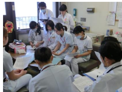
カンファレンスの様子

医師・・・病状の把握、栄養障害の程度や栄養療法の効果の判定、方針の決定 看護師・・・病状観察、入院生活や食事に関する情報提供、身体測定 薬剤師・・・栄養剤の説明や検討、処方内容把握、服薬指導 管理栄養士・・・栄養アセスメントとモニタリング、 食事形態や必要栄養量の検討、栄養指導 臨床検査技師・・・血液検査データの把握、 検査データに関わる情報提供や問題点の抽出 言語聴覚士・・・摂食嚥下障害に関する情報提供、リハビリの実施 歯科衛生士・・・口腔ケアに関する情報提供、口腔ケア指導