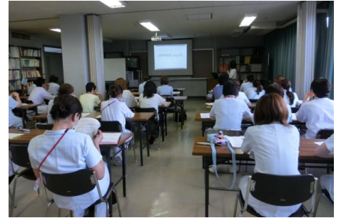
(平成25年度栄養セミナーの様子)

今後も積極的に NST 活動に取り組み、栄養サポートを行う事で患者様の入院生活を支えていきたいと思ひます。