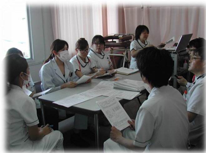
カンファレンス風景

外科の症例が中心で他科からのコンサルトが少ないのが現状です。緩和ケア研修を終了した外科医を中心にチームで介入することで、疼痛緩和が得られていると思っています。