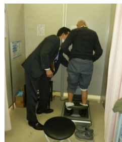
《体脂肪検査の様子》

心臓友の会では東、西医療センターで治療をされている心臓病の患者様も含めて広く会員募集中ですので、少しでもご興味を持って頂いた方は桑名南医療センター心臓友の会事務局までお気軽にお問い合わせください。