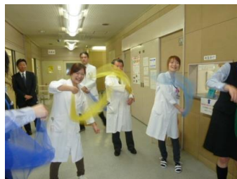
《職員も一緒に楽しみました》