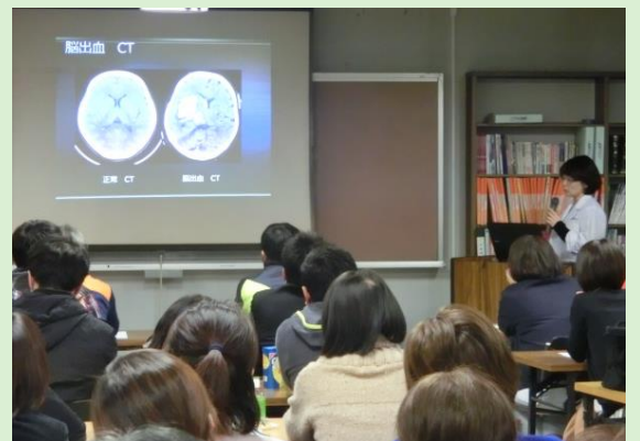
↓ 講義：『脳卒中の画像診断』の様子

参加人数は 70 人を超えて、立ち見が出る状態でした。同じ救急活動に携わる病院と消防の顔の見える関係作りに本会は大変役立っていると考えています。